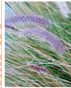
RABO DE GATO